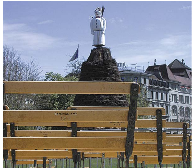
Ein Bild von früher: Die Zeiten ändern sich, doch eines bleibt gleich: Das Warten auf den grossen Knall am Sechseläuten. Dieses Jahr stehen gleich mehrere Premieren an.

Aufgeregt im Sinne von nervös bin ich nicht. Höchstens aufgeregt vor lauter Vorfreude, stehen doch dieses Jahr gleich mehrere Premieren an. Nicht nur der Sechseläutenplatz ist neu, auch kommt mit Obwalden ein Gastkanton ans Sechseläuten, der noch nie da war. Die Inner-schweizer sind sehr kreativ, präsentieren eine Äplerchilbi auf dem Lindenhof, stellen gleichenorts Obwaldens touristische Attraktionen in der Form eines Familienparcours vor und am Kinderumzug findet ein Alpbazug mit lebendigen Geisslein statt. Auch haben die Obwaldner ihr weisses Buch von Sarnen mitgebracht, das im Landesmuseum ausgestellt ist. Auch auf die Premiere, von der jetzt alle reden, freue ich mich natürlich. Wir, das Zentralkomitee der Zünfte Zürichs, sind sehr